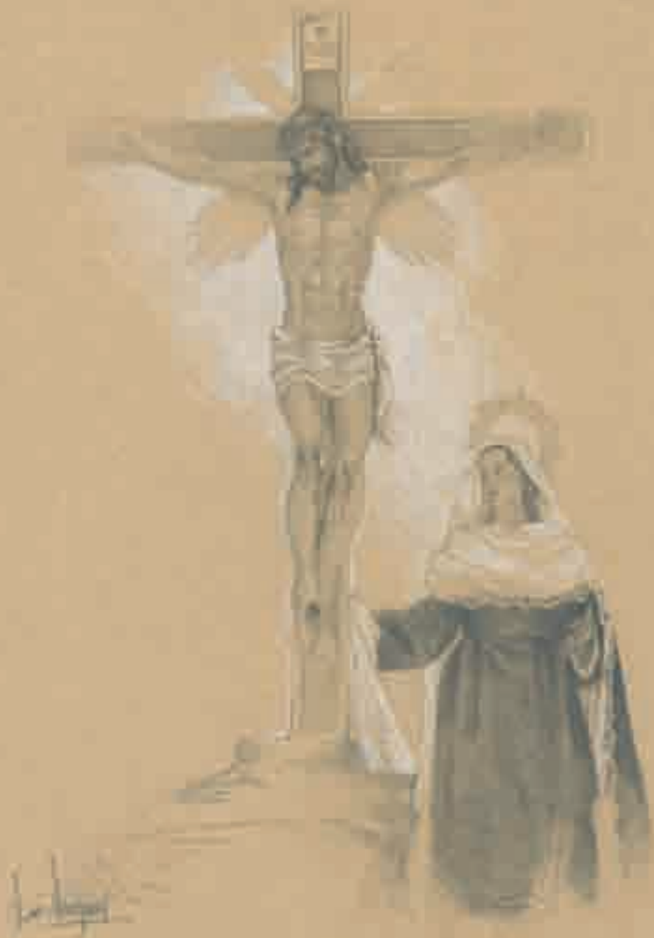
Stmo. Cristo de la Agonía y Ntra. Sra. de la Amargura