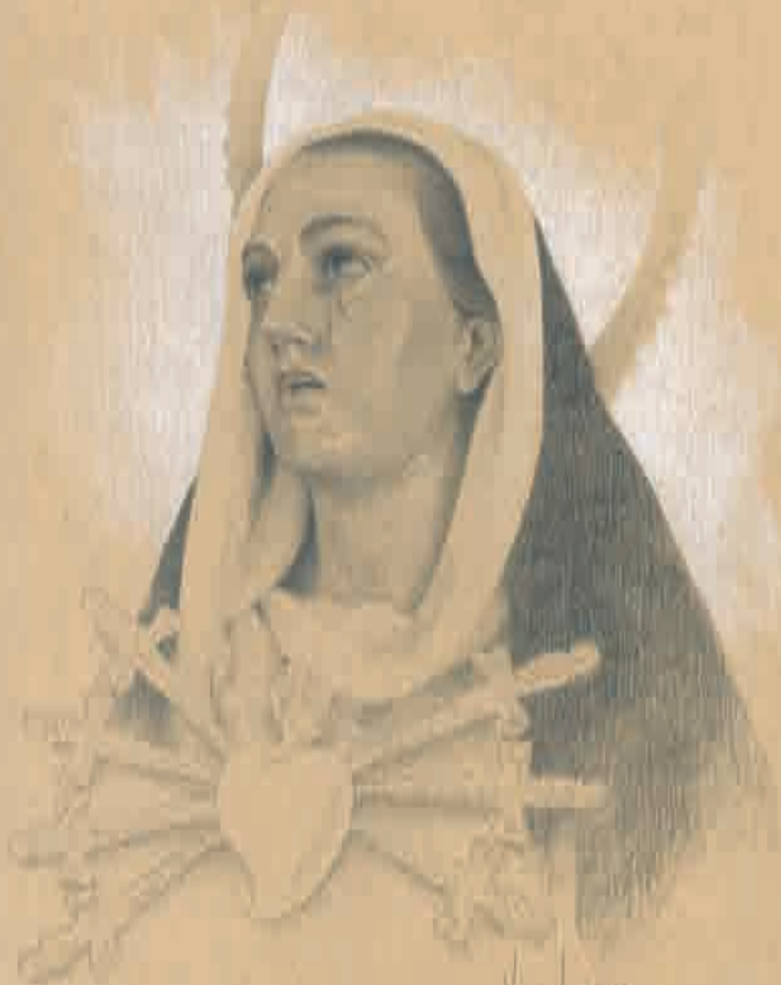
Ntra. Sra. de los Dolores