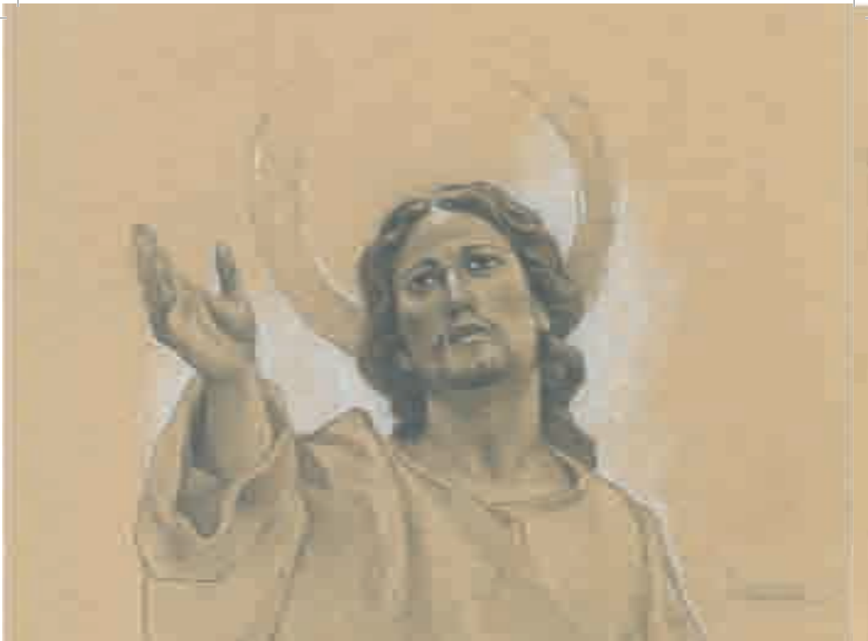
San Juan Evangelista