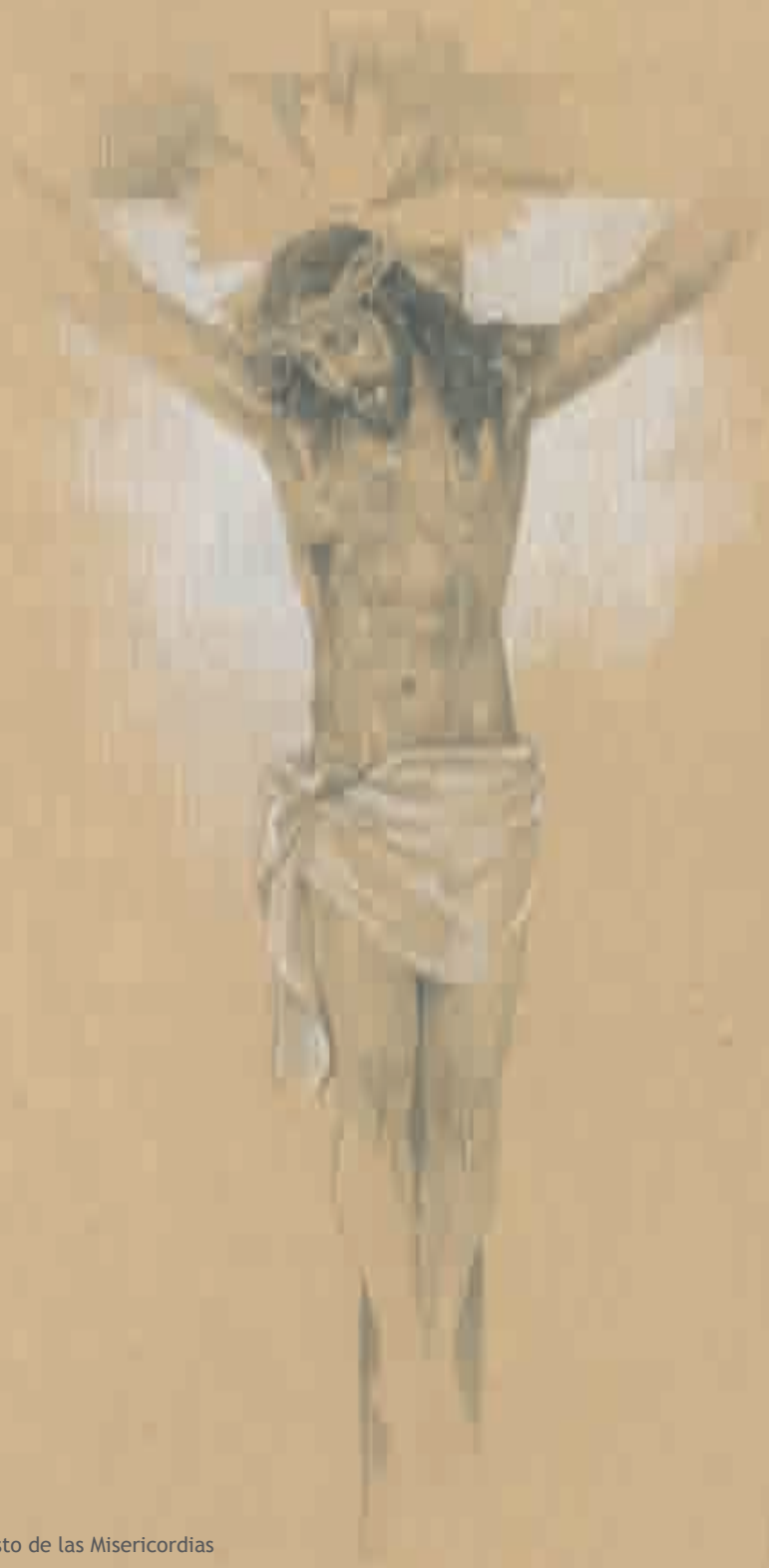
Stmo. Cristo de las Misericordias