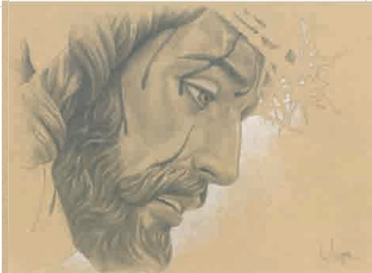
Stmo. Cristo de la Misericordia