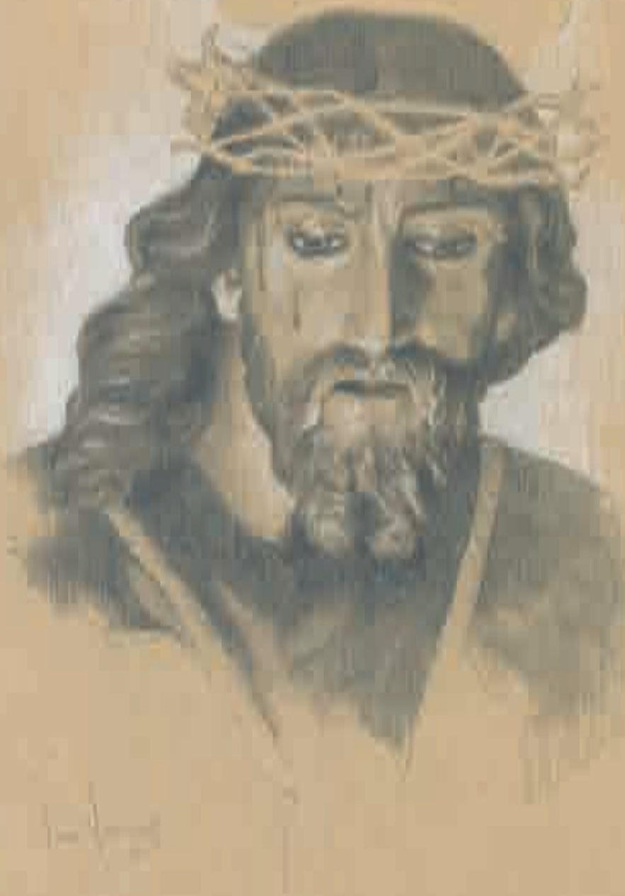
Ntro. Padre Jesús Nazareno