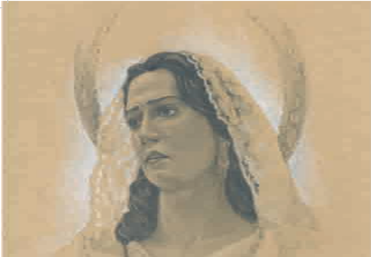
Sta María Magdalena