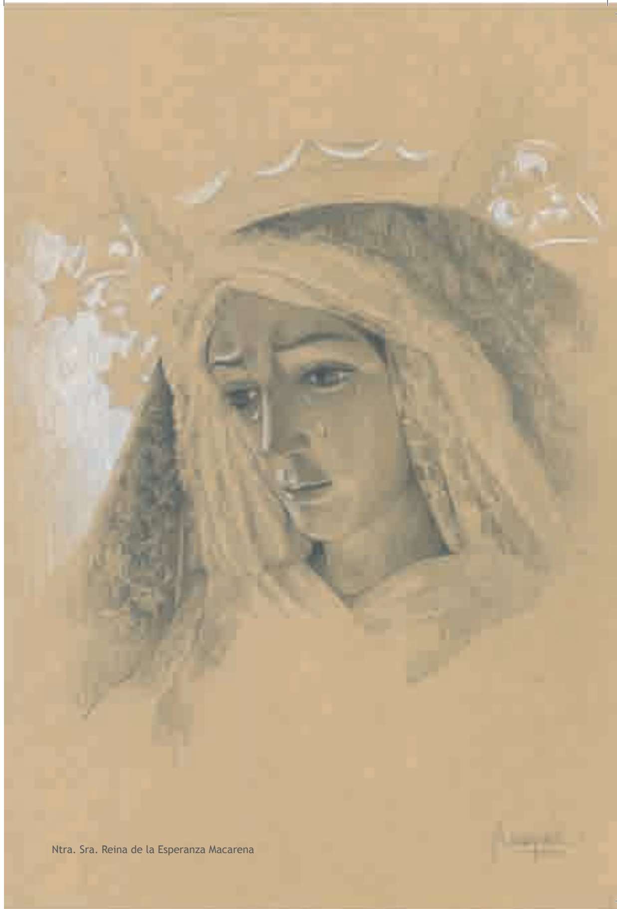
Ntra. Sra. Reina de la Esperanza Macarena