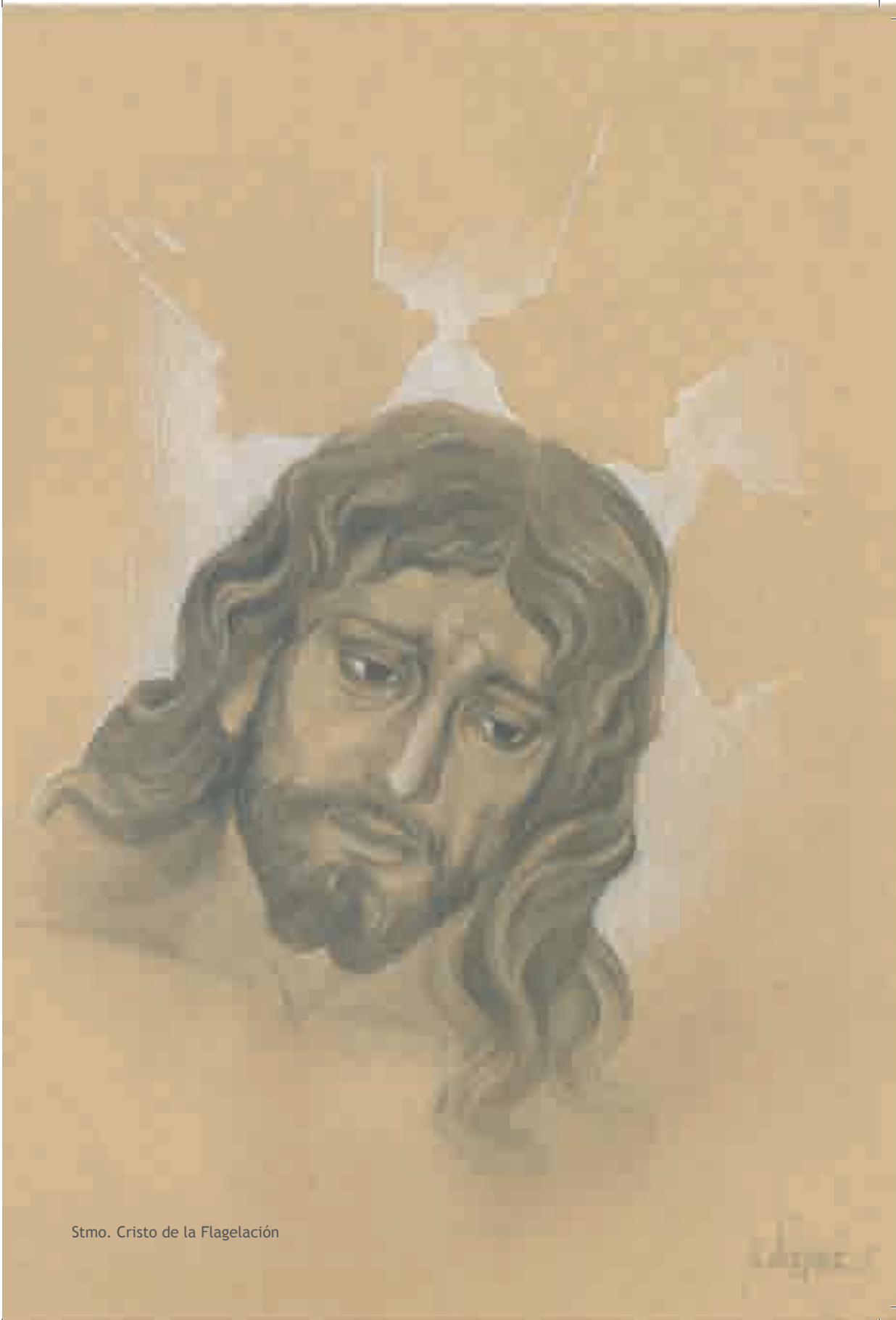
Stmo. Cristo de la Flagelación