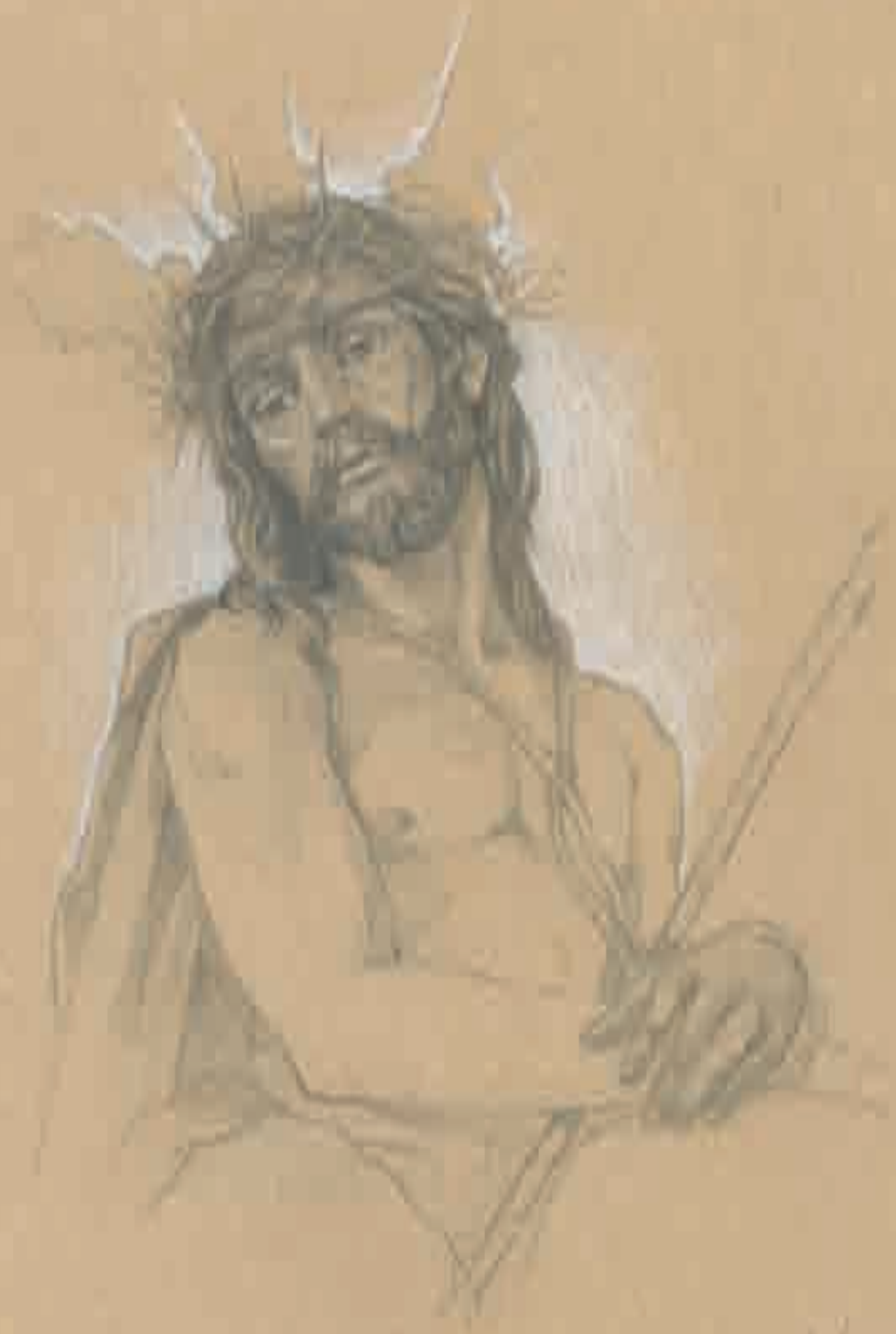
Stmo. Cristo de la Coronación de Espinas