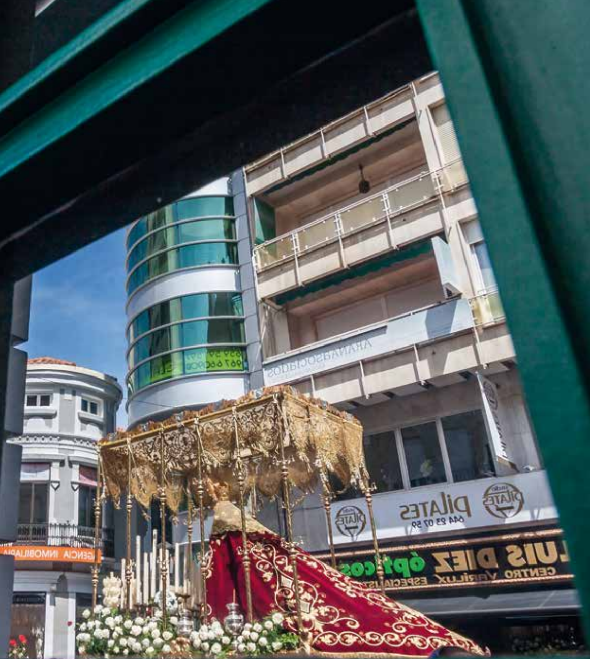
Imagen Ntra. Sra. del Mayor Dolor

Cofradía COFRADÍA DE NTRA. SRA. DEL MAYOR DOLOR.