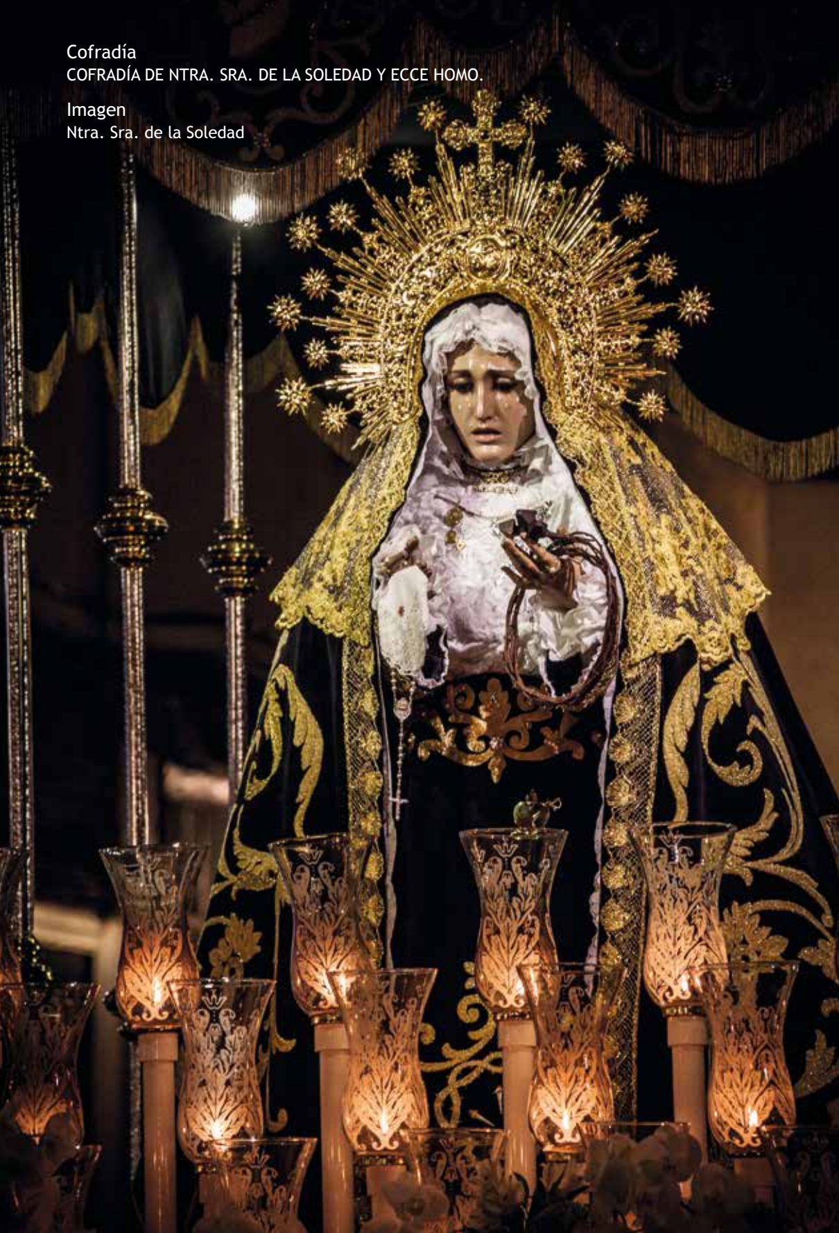
Imagen Ntra. Sra. de la Soledad

Cofradía COFRADÍA DE NTRA. SRA. DE LA SOLEDAD Y ECCE HOMO.