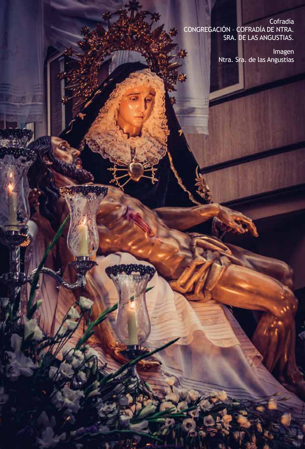
Imagen Ntra. Sra. de las Angustias

Cofradía CONGREGACIÓN - COFRADÍA DE NTRA. SRA. DE LAS ANGUSTIAS.